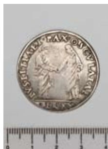
Osella in argento del doge Antonio Grimani, 1521. Recto e verso.