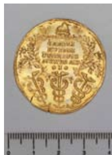
Osella d'oro da sei zecchini del doge Carlo Ruzzini, 1732. Recto e verso.